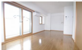
※室内写真は403号室となります。