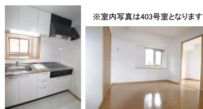
※室内写真は403号室となります。