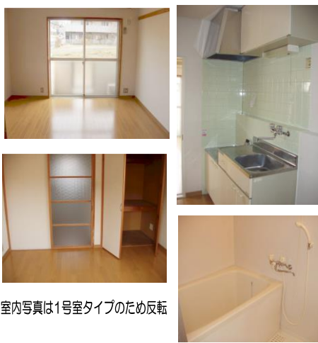
※室内写真は1号室タイプのため反転