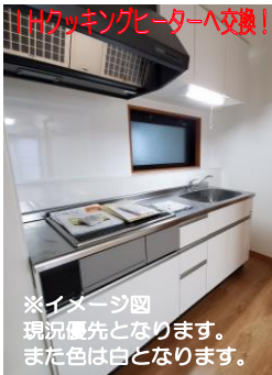
※イメージ図 現況優先となります。 また色は白となります。

①システムキッチン交換 ガスコンロからお手入れの楽チンなIHクッキングヒーターへ交換!