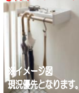
※イメージ図 現況優先となります。