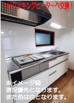
※イメージ図 現況優先となります。 また色は白となります。