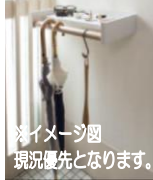
※イメージ図 現況優先となります。