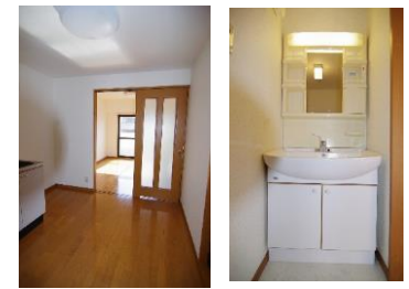
※室内写真は301号室となります。

※退去・入居時期はあくまで予定となります。 変更となる場合がございます事、予めご了承ください。