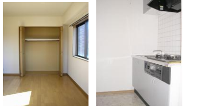
※室内写真は3号室のため間取りが違います。参考資料としてご利用下さい。

101号室 今回募集 家賃: 45,000円 管理費: 2,500円 償却負担金: 880円 (即入居可) 使用部分面積: 22.05㎡