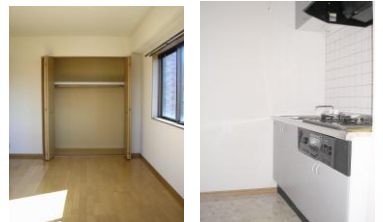
※室内写真は3号室のため間取りが違います。参考資料としてご利用下さい。

102号室 今回募集 家賃: 44,000円 管理費: 2,500円 償却負担金: 880円 (即入居可) 使用部分面積: 22.05㎡