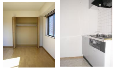
※室内写真は3号室のため間取りが違います。参考資料としてご利用下さい。

202号室 今回募集 家賃: 46,000円 管理費: 2,500円 償却負担金: 880円 (即入居可) 使用部分面積: 22.05㎡