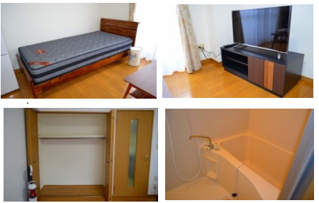
※室内写真は102号室となります。

室内リニューアル 2024年3月リフォーム済! 浴室換気扇交換 洗面化粧台シングルバー式へ交換 浴室水栓サーモスタット水栓へ交換 浴室収納棚取り付け 室内LED照明器具へ交換 ~玄関は人感センサー付きへ交換~