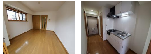
※室内写真は101号室となります。