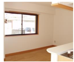
※室内写真は、1号室タイプのため反転となります。