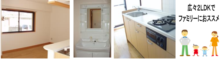
※室内写真は、1号室タイプのため反転となります。

202号室 退去済 家賃: 68,000円 管理費: 3,000円 メンテ保証料: 600円 (緊急修理含む) (即入居可) 使用部分面積: 50.13㎡