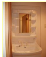
※室内写真は反転タイプ