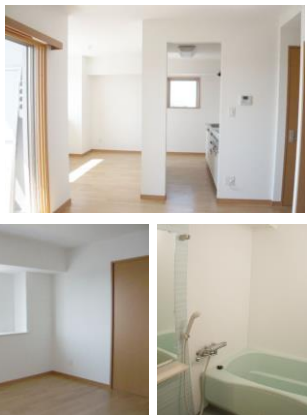
※写真は、反転タイプ