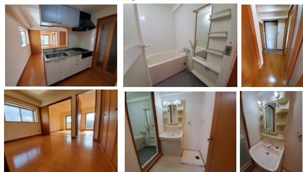
※室内写真は101号室となります。