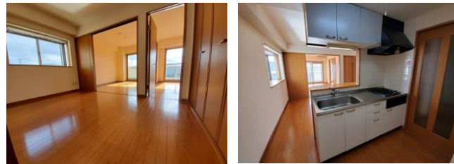
※室内写真は101号室となります。