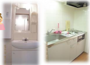
※室無写真は301号室となります。