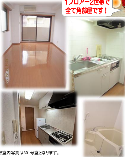
※室内写真は301号室となります。

401号室 退去済 賃料: 55,000円 管理費: 3,000円 緊急メンテ費: 700円 (即入居可) 使用部分面積: 28.01㎡