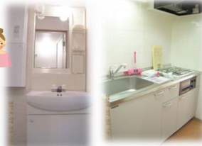
※室無写真は301号室となります。