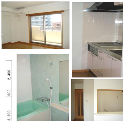
※室内写真は403号室のため、参考資料としてご利用ください。

退去済 501号 家賃:76,000円 管理費:4,000円 メンテ保証料:600円 (緊急修理含む) (即入居可) 使用部分面積:50.40㎡