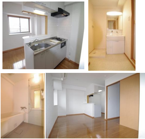
※室内写真は2号室となります。

※敷金3ヶ月・礼金1ヶ月での契約も可能です。 その場合は、償却負担金は不要となります。