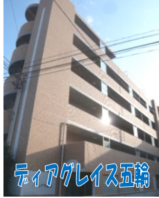
ディアグレイス五輪