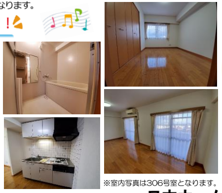
※室内写真は306号室となります。

*今回募集* 退去予定 306号室 家賃：76,000円 管理費：4,000円 メンテ保証料：600円 (緊急修理含む) 2/末退去予定・ 3/中旬入居可予定 使用部分面積：55.80㎡