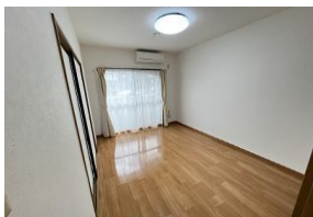
※室内写真は106号室のため反転となります。