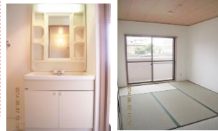
※室内写真は、103号室のため反転となります。

※退去・入居時期はあくまで予定となります。 変更となる場合がございます事、予めご了承願います。