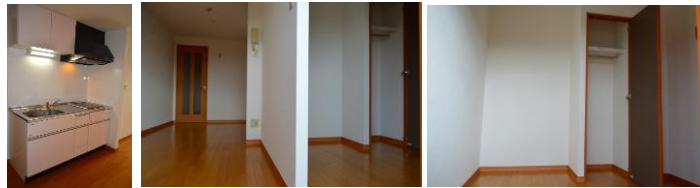
※室内写真は、503号室となります。