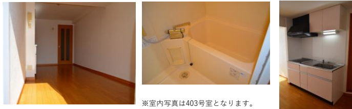
※室内写真は403号室となります。

リニューアル内容 ~2019年10月末完成~ ①間取り変更(2K→2DK) ②キッチン交換 ガスコンロ→IHクッキングヒーターになります。) ③照明器具LEDへ交換 さらに玄関照明人感センサーへ ④樹脂サッシ取付で防音・結露対策に最適! ⑤フローリング全面張替 ⑥壁クロス部分張替 ⑦浴室サーモスタッド水栓へ交換 さらに、シャンプー棚取付で便利になります! ⑧洗面化粧台シャンプードレッサーへ交換