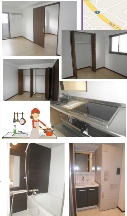
※室内写真は106号室となります。