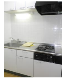
※室内写真は303号室となります。

※今回募集※ 203号室 退去済 家賃：54,000円 管理費：4,000円 メンテ保証料：600円 (緊急修理含む) (即入居可) 使用部分面積：34.45㎡