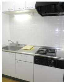
※室内写真は303号室となります。

*今回募集* 403号室 退去済 家賃：56,000円 管理費：4,000円 メンテ保証料：600円 (緊急修理含む) (即入居可) 使用部分面積：34.45㎡