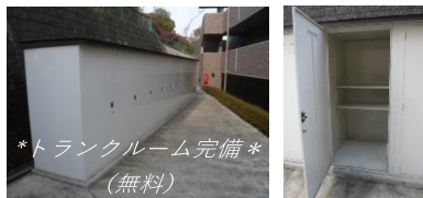
*トランクルーム完備* (無料)