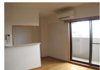
※室内写真は102号室となります。