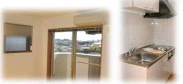
※室内写真は203号室となります。