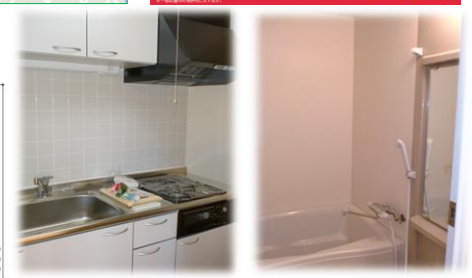
※室内写真は205号室となります。

日本ホームのマンションは、 都市ガス以下の料金で ガス代が お得! 月額 770円