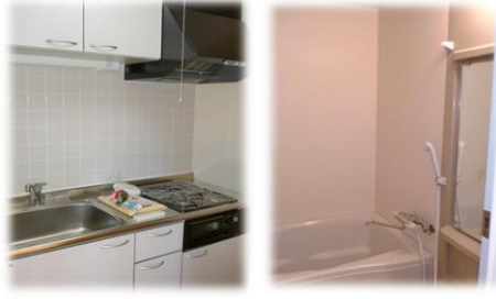
※室内写真は205号室となります。