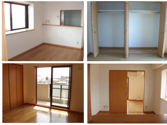
※室内写真は1号室となります。(キッチンが2号室)

●●今回募集●● 301号室 退去済 家賃: 66,000円 管理費: 3,500円 メンテ保証料: 600円 (緊急修理含む) (即入居可) 使用部分面積: 36.55㎡