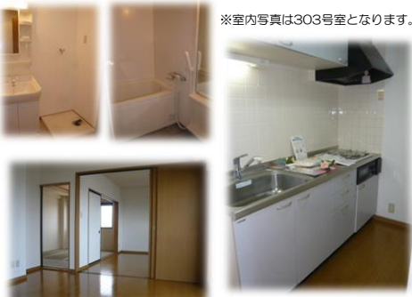
※室内写真は303号室となります。