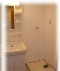
※室内写真は303号室のため反転となります。