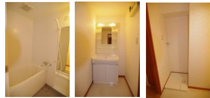
※室内写真は402号室となります。