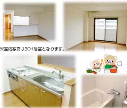
※室内写真は301号室となります。