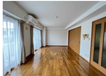
※室内写真は101号室となります。

101号室 退去済 家賃：64,000円 管理費：3,000円 緊急メンテ費：700円 (即入居可)