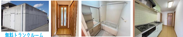
無料トランクルーム