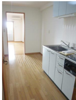
※室内写真は407号室の為 反転となります。