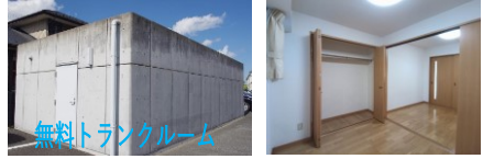
無料トランクルーム