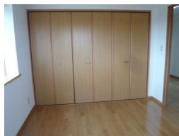
※室内写真は407号室となります。