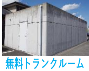
無料トランクルーム

507号室 退去済 家賃: 65,000円 管理費: 4,000円 緊急メンテ費: 700円 (即入居可) 使用部分面積: 50.92㎡