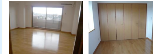
※室内写真は407号室となります。

JR『南仙台』駅 1.1km 徒歩 15分 仙台市立中田小学校 1.2km 徒歩 15分 仙台市立中田中学校 900m 徒歩 12分 宝保保育園 1.2km 徒歩 15分 JCHO 仙台南病院 700m 徒歩 9分 ファミリーマート太田中田店 96m 徒歩 2分 セブンイレブン南病院前店 550m 徒歩 7分 ヤマザワ中田店 600m 徒歩 8分 ダイシン中田店 750m 徒歩 10分 ドン・キホーテ仙台南店 850m 徒歩 11分 万代仙台南店 400m 徒歩 5分 西松屋 仙台中田店 450m 徒歩 6分 仙台市立中田温泉水プール 400m 徒歩 5分 中田中央公園 750m 徒歩 10分