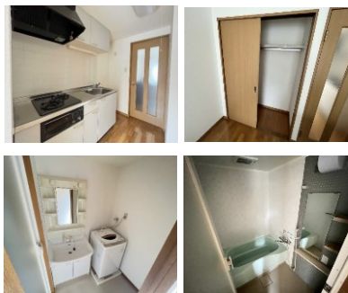
※室内写真は102号室となります。

☆今回募集☆ 102号室 退去済 家賃:44,000円 管理費:3,000円 緊急メンテ費:700円 (リフォーム中・4月中旬入居可予定) 使用部分面積:28.05㎡