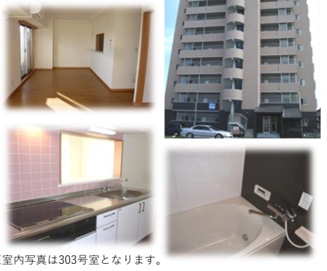
※室内写真は303号室となります。

103号室 退去済 家賃 85,000円 管理費 4,000円 メンテ保証料 600円 (緊急修理含む) (即入居可) 使用部分面積：80.64㎡