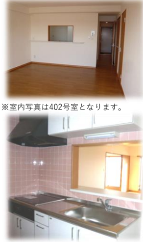
※室内写真は402号室となります。

402号室 過去予定 家賃 83,000円 管理費 5,000円 メンテ保証料 600円 (緊急修理含む) (10/未退去予定・11/未入居可予定) 使用部分面積：80.64㎡