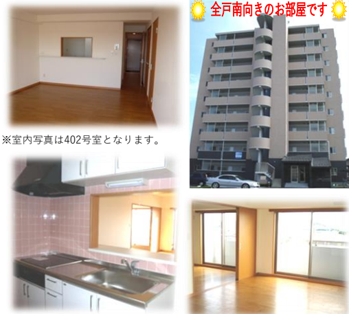
※室内写真は402号室となります。

※退去・入居時期はあくまで予定となります。 変更となる場合がございます事、予めご了承ください。