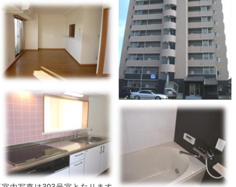
※室内写真は303号室となります。

903号室 退去済 家賃 91,000円 管理費 5,000円 メンテ保証料 600円 (緊急修理含む) (リフォーム中 12/中旬入居可予定) 使用部分面積: 80.64㎡