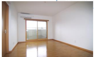
※室内写真は203号室となります。

103号室 退去済 家賃：60,000円 管理費：3,000円 メンテ保証料：600円 (緊急修理含む) (即入居可) 使用部分面積：40.26㎡