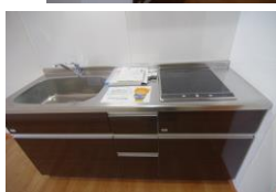
※室内写真は302号室となります。