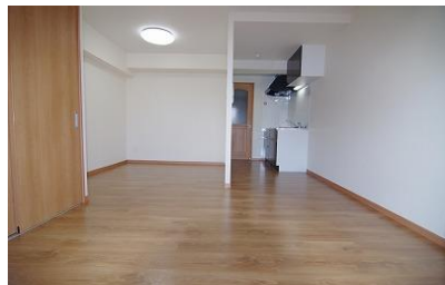
※室内写真は103号室となります。